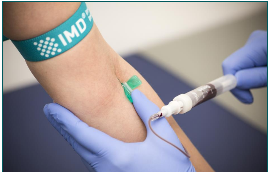
Für die Lipidanalytik wird keine Nüchternheit mehr verlangt.